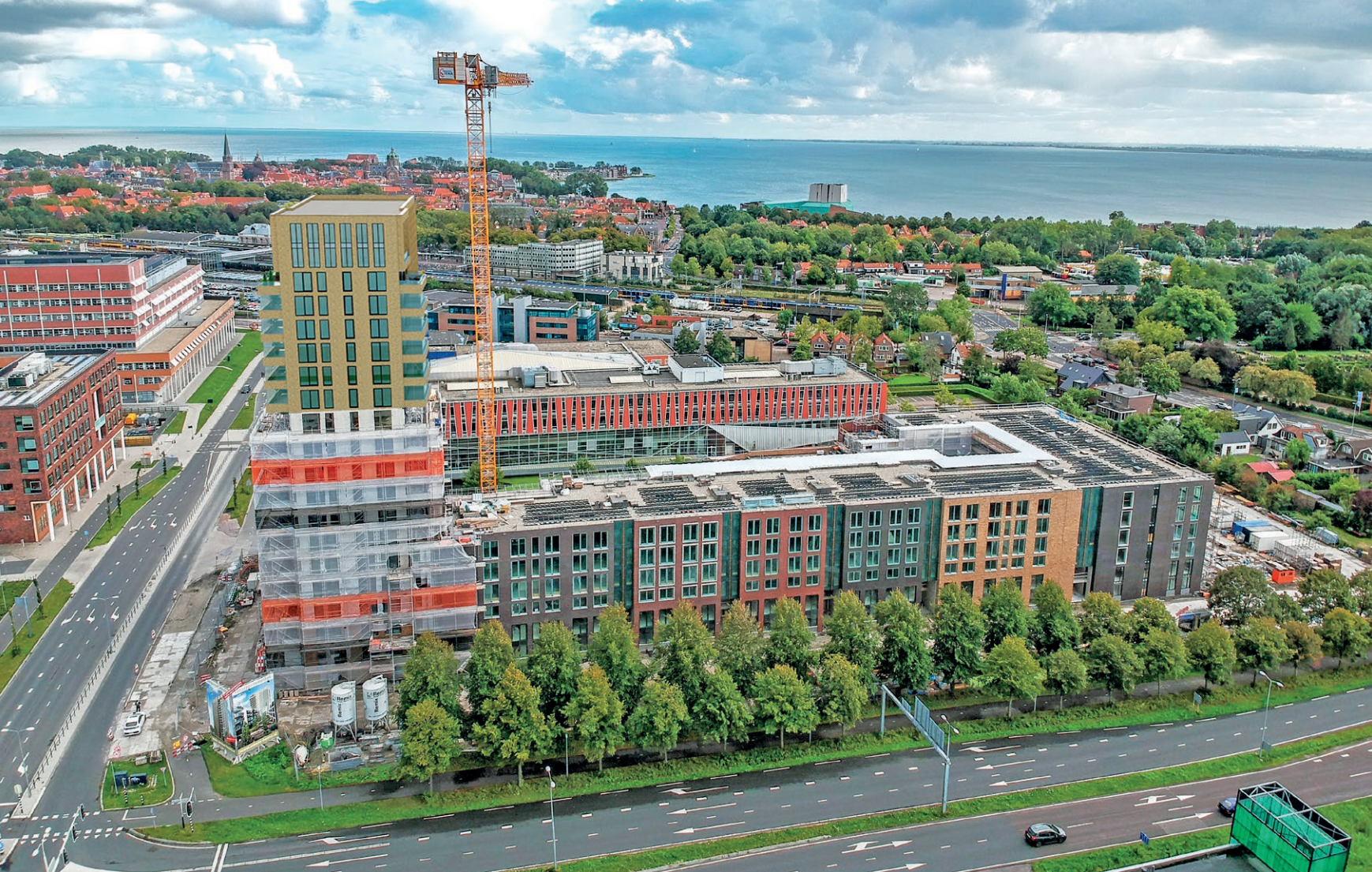
Nieuw woningbouwproject de TOREN, met op de achtergrond het station, de binnenstad en het Markermeer.